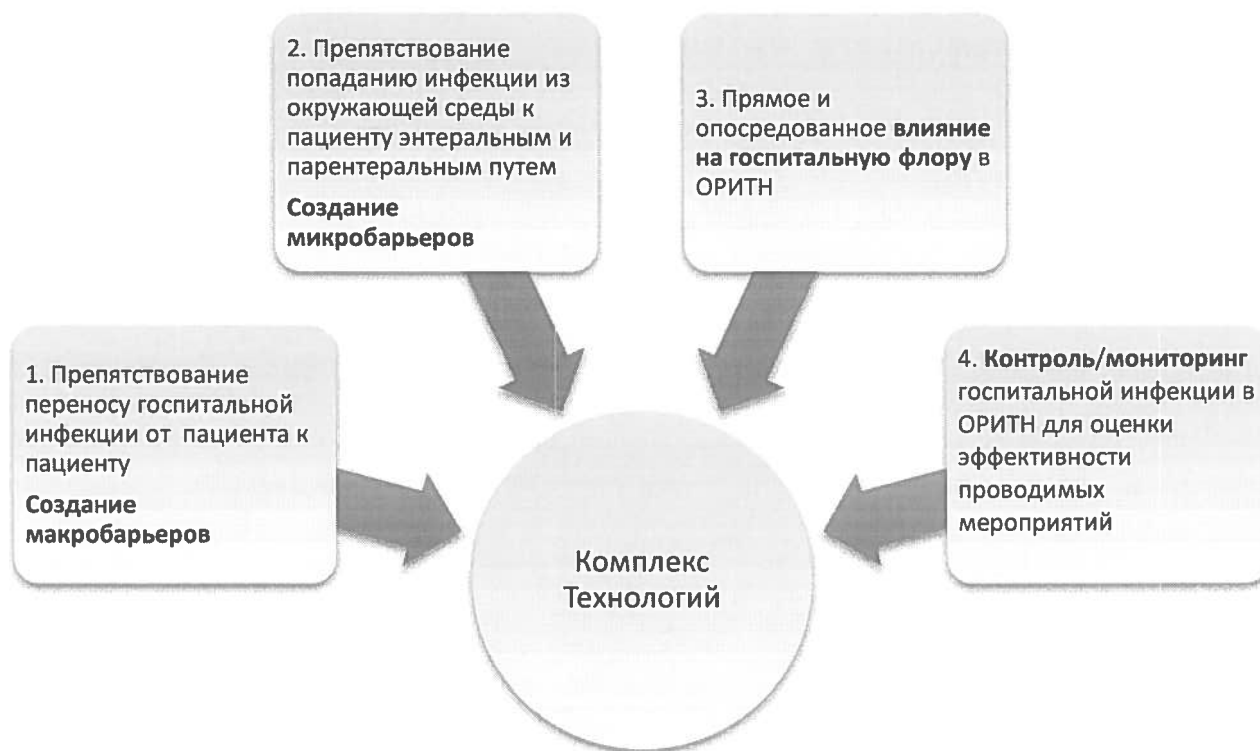
Рисунок. 1 Комплекс технологий системы профилактики госпитальной инфекции

Для успешного функционирования этой системы необходимо одновременное выполнение комплекса технологий: (рис.1)